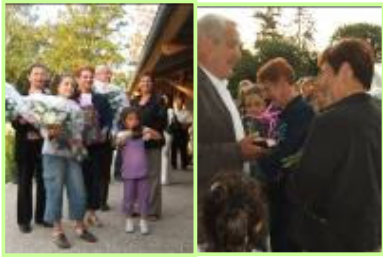
Le Maire a remis le médaillon de la ville aux trois retraités